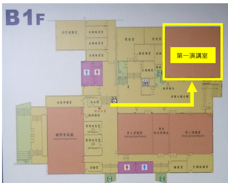
國立成功大學光復校區國際會議廳 B1 第一演講室－臺南市東區大學路 1 號